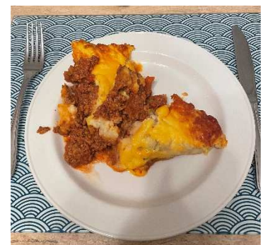
ラザニア(ジャガイモ)