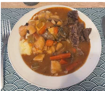
アイリッシュシチュー

・ 夕食 夕食はホストマザーが毎日作って下さいます。アイルランドはジャガイモが主食と聞いていたため、お米が出てきて驚きました！毎日メニューが違うため、今日はどんな料理が出るのかワクワクしながら家に帰っています。