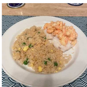
・煮魚と小エビ ・ライス（タイ米）